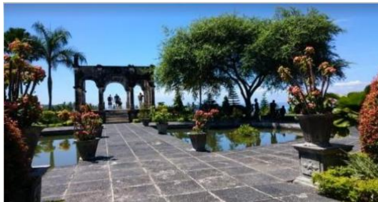
Gambar 4. Balai Kapal Taman Soekasada Ujung

Beberapa bangunan yang ada di Taman Soekasada Ujung masing-masing memiliki nilai sejarah seperti: bale kapal yang terletak pada pintu masuk utama, yang mengandung arti secara keseluruhan merupakan alat kompas untuk mengarahkan rakyat untuk mencapai kesejahteraan secara jasmani dan rohani. Bangunan Balai Kapal dapat dilihat pada Gambar 4 berikut.