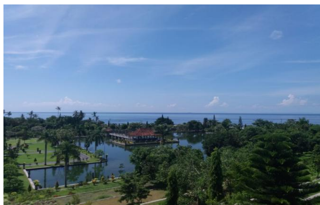
Gambar 2. Keindahan Alam Pantai Ujung

Jika pengunjung mengarahkan pandangan ke sisi tenggara dari Taman Soekasada ini akan disuguhi pemandangan lautan biru Pantai Ujung Karangasem. Selain itu, dari bangunan ini juga dapat melihat keindahan panorama Bukit Bisbis yang memiliki bentangan alam menghijau di kejauhan, seperti ditampilkan gambar 2 berikut.