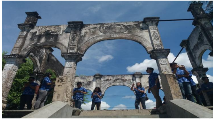
Gambar 3. Bangunan dengan Pilar-Pilar Besar Tanpa Atap

Pada Gambar 2 di atas dapat tampak dengan jelas keindahan bentangan alam di sepanjang Pantai Ujung Karangasem dengan air laut yang berwarna kebiruan. Yang menonjol dari Taman Soekasada adalah area bangunan tertinggi yang dihiasi pilar-pilar besar tanpa atap. Pilar besar semacam ini tidak dapat ditemukan di destinasi warisan lain sehingga pilar-pilar besar tanpa atap itu menjadi ciri khas Taman Soekasada, seperti ditampilkan gambar 3 berikut.